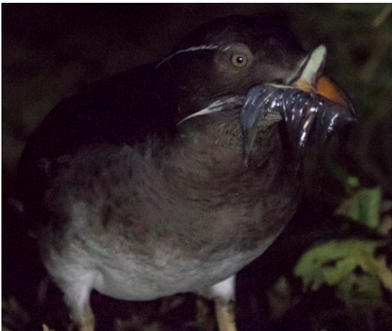
ウトウ。5月中旬以降から魚を運ぶ

5月の天売島には、北へ向かう多くの渡り鳥が羽を休め、野鳥観察をするには絶好の場所です。カシラダカ、オオルリ、センダイムシクイなどが道路脇や庭先、あるいは畑など、人々の暮らしのすぐそばに普通に観察できます。そのなかには、国内ではほとんど目にできない珍鳥が含まれることも珍しくありません。そんな絶好のフィールドを、天売島野鳥歴36年の寺沢孝毅をはじめとするプロガイドがご案内します。初心者も大歓迎です。鳥を見はじめたばかりの方も安心してご参加ください。